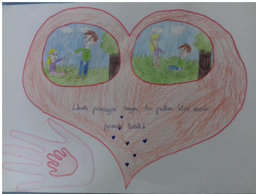
Natan Pieszczyk klasa III c